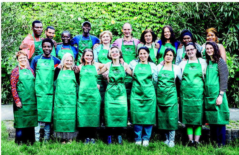
L'équipe de Cuisine sans Frontières